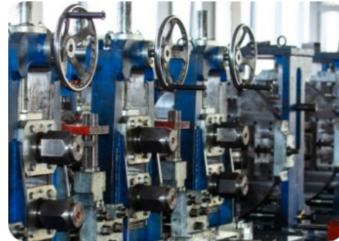
Certificación de herramientas