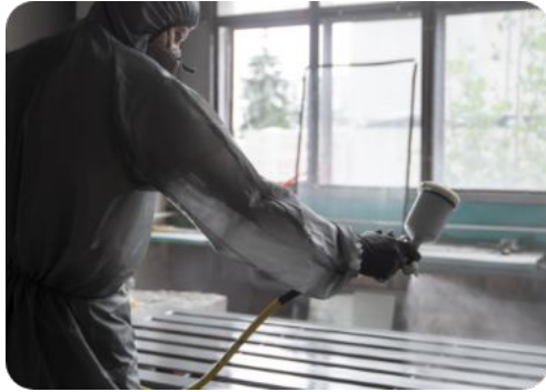
Servicios de acabado y tratamiento de superficies