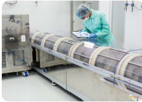
Movimientos de celdas de producción