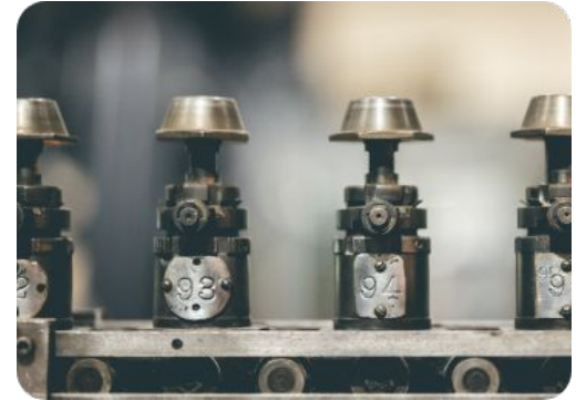
Prototipado rápido y producción en serie