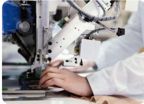
Fabricación de componentes personalizados