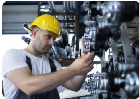
Ensamble de herramientas