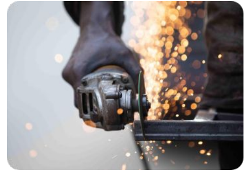
Fabricación de herramientas