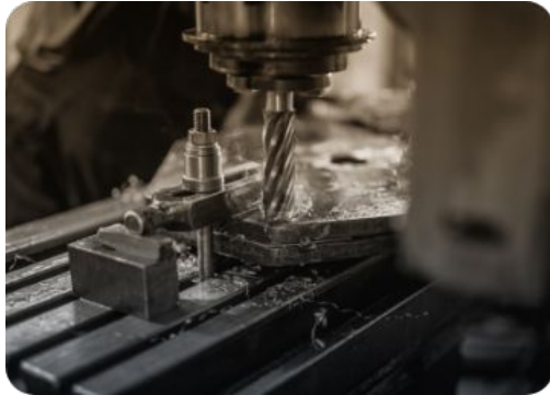
Fresado y torneado de piezas